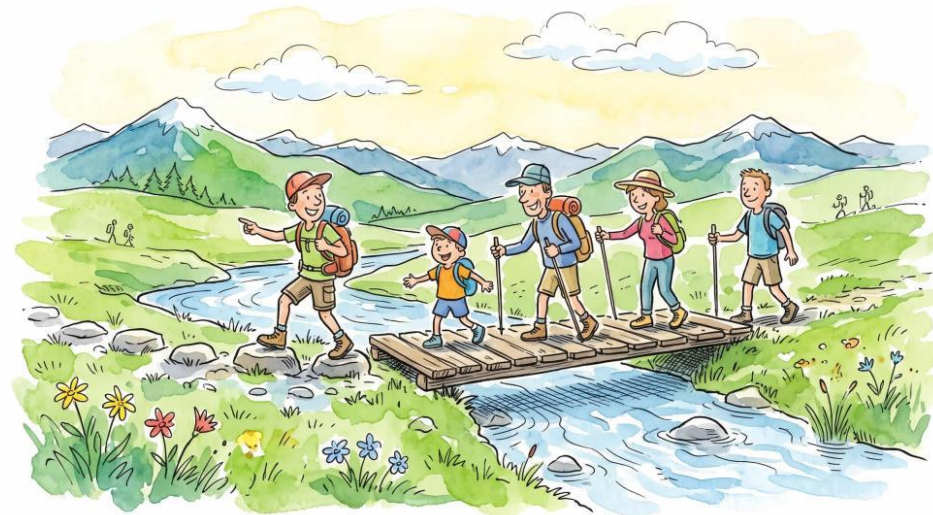
День на природе Грузии

Наденьте удобную обувь для похода и возьмите с собой воду, перекус, средство от солнца и лёгкую куртку для открытого гребня. Маршрут может быть скорректирован в зависимости от погоды и темпа группы.