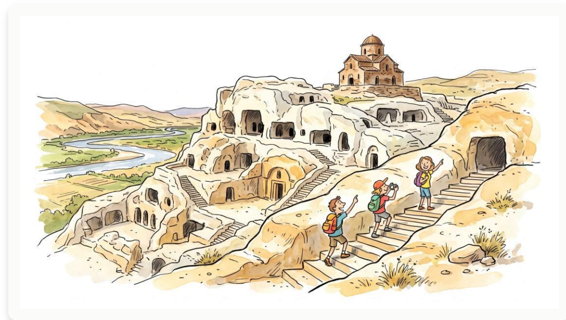
Древний скальный город