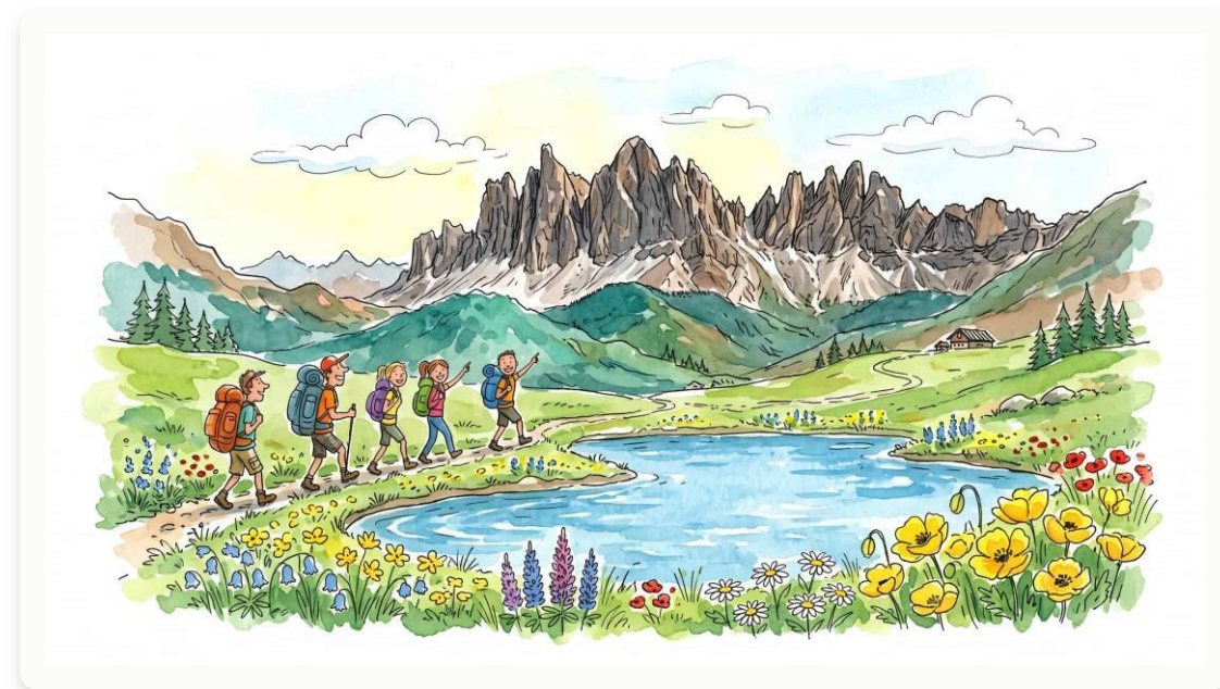
Открытые гребневые тропы

Основной поход проходит по хребту Квернаки, известному своими открытыми пейзажами и широкими панорамными видами. Маршрут сочетает гребневые тропы, природные пейзажи и спокойную атмосферу — это отличная прогулка в стороне от туристических троп, в комфортном темпе с сертифицированным гидом.